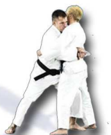
Défense sur saisie de face