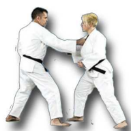
Défense sur saisie du revers

Self-défense Je sais construire un enchainement dans les situations suivantes :