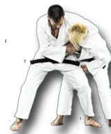
Défense sur saisie de côté