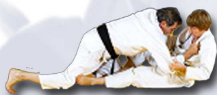
Renversement partenaire entre les jambes