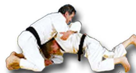
Retournement de face