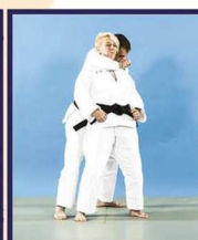
Hadaka-jime Étranglement par l'arrière