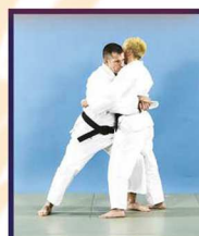
Mae-dori Saisie de face en ceinturant sous les bras