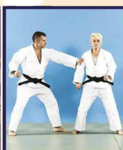
Yako-sode-dori Saisie de la manche de côté