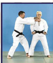
Yako-kubi-dori Saisie à deux mains de côté au cou