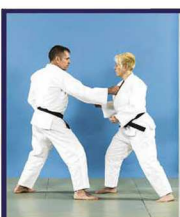
Eri-dori Saisie croisée du revers