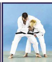
Yako-kubi-dori Saisie du cou de côté