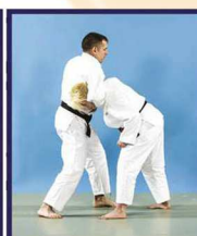
Mae-kubi-dori Saisie du cou de face