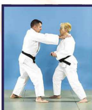
Mae-kubi-dori Saisie à deux mains au cou