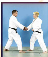
Katate-dori Saisie du poignet à deux mains