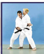
Yako-dori Saisie de côté en ceinturant les bras