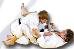
Reprise d'initiative entre les jambes du partenaire