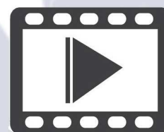
Enchaînement des immobilisations Variantes des immobilisations