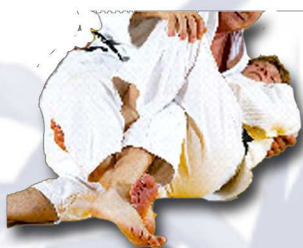
Je sais défendre : ciseaux, plat ventre, ponter